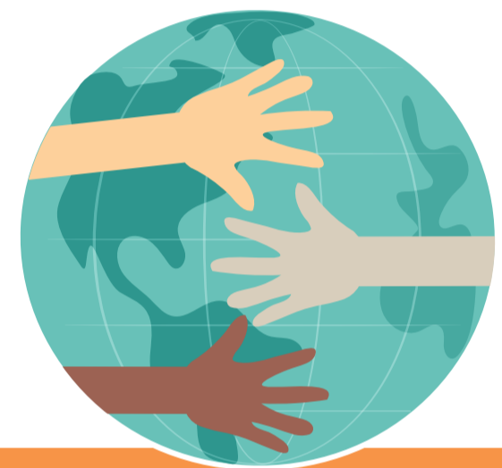
“La primera Constitución Social del Siglo XX”

En 136 artículos contiene los derechos aplicables a toda la ciudadanía, en ella también se detallan las obligaciones y atribuciones de las autoridades para sus funciones, establece la forma de gobierno republicana, representativa, democrática, laica y federal.