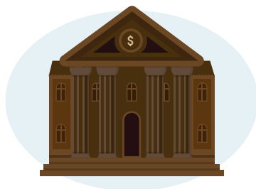
Poder Ejecutivo Federal

De acuerdo con Rafael Morgan ( et. al. ) “Un buen ejercicio de rendición de cuentas obliga a los servidores públicos a reportar sus actos y los resultados en el cumplimiento de planes y programas gubernamentales de los que son responsables, y dota a la ciudadanía de mecanismos para monitorear y evaluar su desempeño.” 1