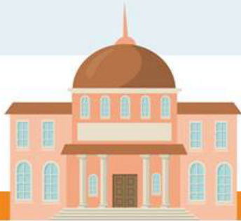
Tribunal Mayor de Cuentas