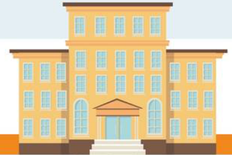
Contaduría Mayor de Hacienda 16 de noviembre

Tras la Consumación de la Independencia en 1821, la naciente nación debía reafirmar si continuaba con una institución de la Colonia o daba paso a la fundación de una nueva institución. El Tribunal Mayor de Cuentas, estuvo vigente durante 300 años y realizaba las funciones de fiscalización y vigilancia de la hacienda pública.