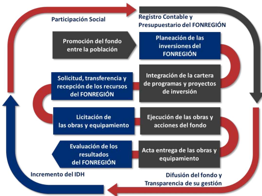
DIAGRAMA DEL PROCESO DE LA GESTIÓN

Las entidades federativas con la participación de la población determinan las necesidades de infraestructura y equipamiento para realizar su planeación e integrar la cartera de programas y proyectos de inversión que presentan a la Secretaría de Hacienda y Crédito Público para la aprobación y transferencia de los recursos asignados en el Presupuesto de Egresos de la Federación. Una vez obtenidos dichos recursos, las dependencias ejecutoras licitan, contratan, ejecutan y entregan las obras públicas y su equipamiento a los beneficiarios y mediante indicadores estratégicos y de gestión evalúan los logros alcanzados en el desarrollo humano con la aplicación de los recursos del FONREGION.