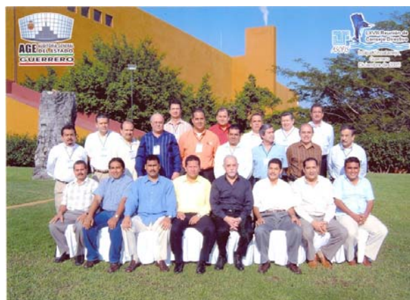
Diversas reuniones del Consejo Directivo de ASOFIS: Ixtapan de la Sal, 2002 (arriba), Manzanillo, 2004 (en medio), e Ixtapa Zihuatanejo, 2005 (abajo)