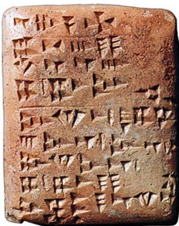
Tablilla de arcilla que muestra la escritura cuneiforme, en donde se plasmaban las cuentas de las civilizaciones antiguas

Alrededor del año 3000 a.c., culturas como los Sumerios, los Acadios, los Babilonios y los Asirios florecieron en las ciudades-Estado, en donde se dieron importantes avances como la escritura cuneiforme, el derecho, las matemáticas, la rueda, la arquitectura (con adelantos como la bóveda y la cúpula), la astronomía, el riego artificial, entre otros.