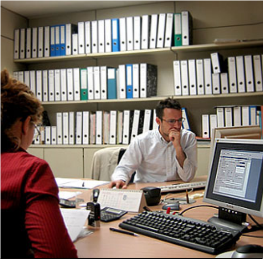
La etapa de planeación es esencial en el proceso metodológico de la ASF

Al concluir esta primera etapa, se desarrolla una planeación específica para identificar aquellos entes públicos encargados de ejecutar los programas prioritarios y estratégicos. Al mismo tiempo, se ponderan las áreas, actividades, proyectos y rubros de ingresos y gastos más significativos.