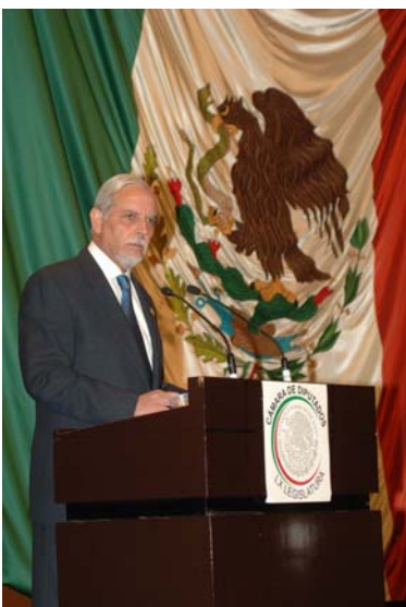
El Auditor Superior de la Federación, el C.P.C. Arturo González de Aragón, en la Cámara de Diputados

El documento se estructura de acuerdo con la clasificación administrativa sectorial del gobierno federal. De esta forma, las entidades fiscalizadas son agrupadas dentro del Poder y Sector al cual pertenecen. Las entidades no coordinadas sectorialmente y los órganos