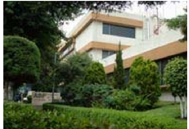
Edificio principal de la ASF, en la Ciudad de México

del gasto federal y políticas y programas públicos, así como la actuación de las dependencias gubernamentales y funcionarios públicos.